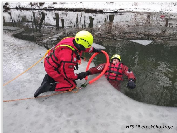
HZS Libereckého kraje

Autor: por. Mgr. Iva Michalíčková koordinátorka preventivně výchovné činnosti HZS Libereckého kraje